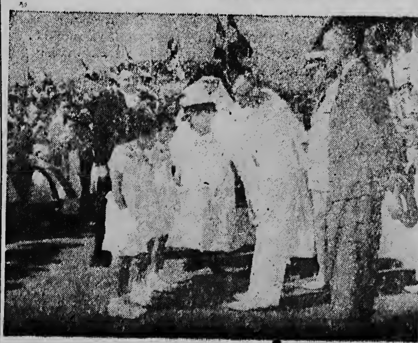
Tijdens een bezoek van Prins Bernhard vertegenwoordigde Aruba's drieling de jeugd van een eiland. Een grote dag in hun leven!